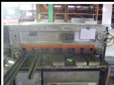
② t 4.5mm ~ 12.0mm × 1250mm(相澤鉄工所製)