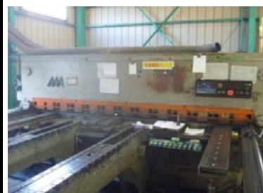
① t 3.2mm ~ t12.0mm × 3100mm(相澤鉄工所製)